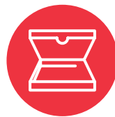
Ngaahi puha pisá (pizza boxes)