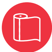
Pepa holoholó (paper towels)