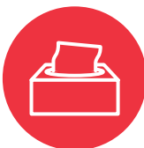
Ngaahi pepa holo matá (tissues)