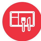
Ko e ngaahi me'a kofukofu mo e fa'o'anga me'a 'oku lava ke fakapalanga