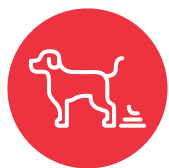
Te'emanu 'o e monumanu tauhí