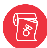
Ngaahi kato 'oku lava ke fakapalanga

Toki fa'o pē 'a e toetoenga me'akaí 'i ho'o pini fa'o'anga toetoenga me'akaí. 'Oku fulihi 'a e toetoenga me'akaí ki ha ngaahi koloa 'oku lava ke nau fakalelei'i hotau kekelé. 'Oku tokoni eni ke tau tō ai ha ngaahi fua'i'akau mo e vesitapolo 'oku mo'ui lelei.