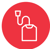
Fanga ki'i tangai tíí