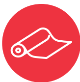
Me'a kofukofu me'akaí